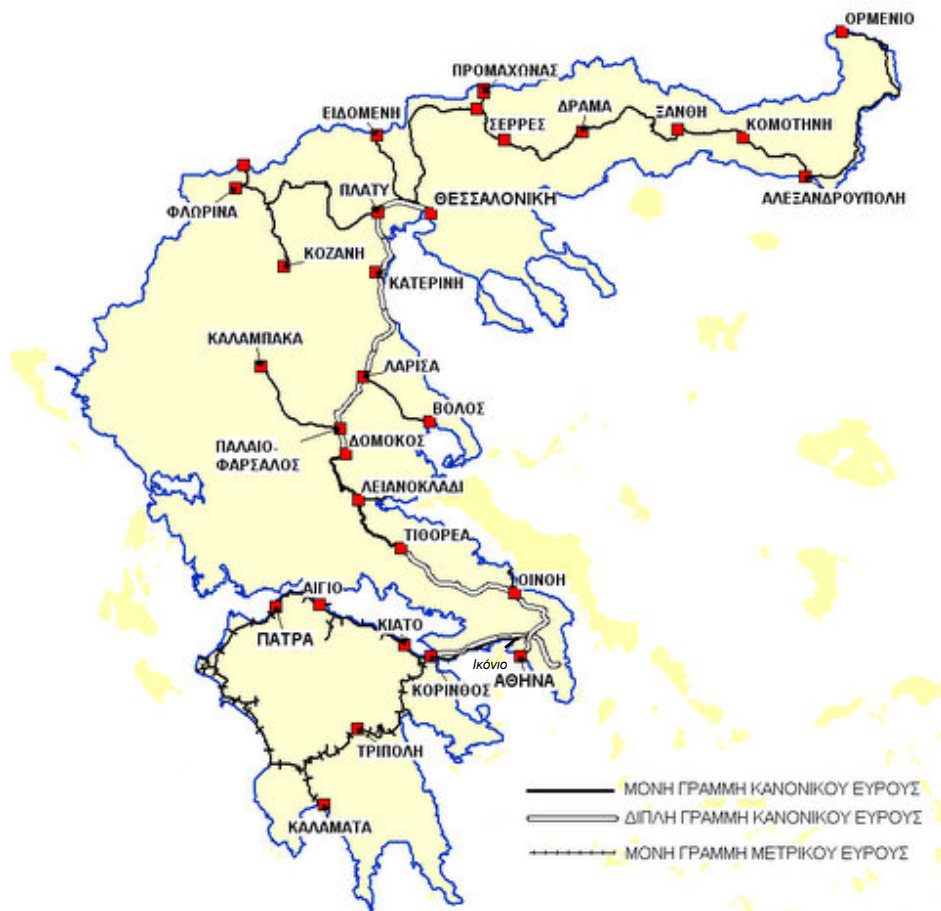
Χάρτης 1 Σιδηροδρομικό Δίκτυο του ΟΣΕ

Οι υπάρχουσες διαδρομές (για τον ορισμό βλ. §1.11) στο σιδηροδρομικό δίκτυο του ΟΣΕ παρουσιάζονται στο ΠΑΡΑΡΤΗΜΑ Ι-Α : Στοιχεία Υποδομής/ Διαδρομές – Τμήμα Πειραιάς – Αθήνα – Πλατύ, ΠΑΡΑΡΤΗΜΑ Ι-Β : Στοιχεία Υποδομής/ Διαδρομές – Μετρική Γραμμή Πελοποννήσου, ΠΑΡΑΡΤΗΜΑ Ι-Γ : Στοιχεία Υποδομής/ Διαδρομές – Τμήμα Φλώρινα – Πλατύ – Αλεξανδρούπολη – Ορμένιο, ΠΑΡΑΡΤΗΜΑ Ι-Δ : Προαστιακός Αθηνών.